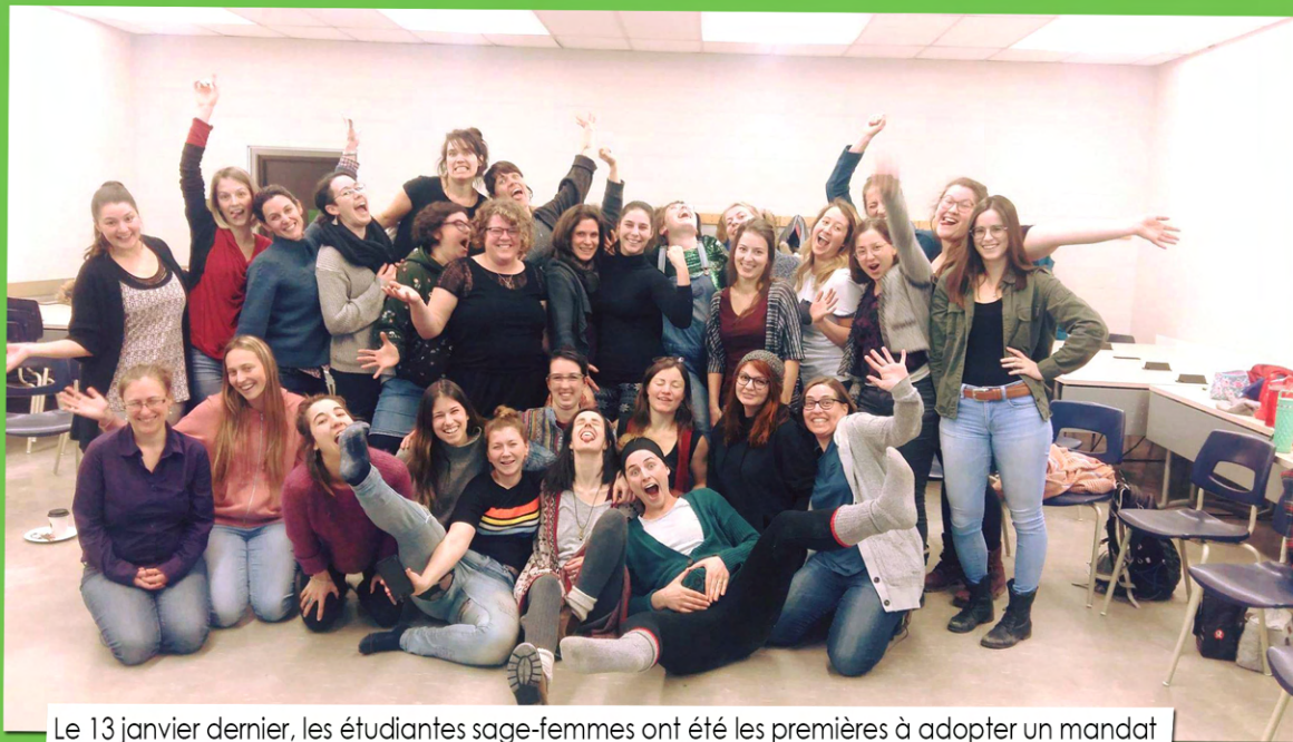
Le 13 janvier dernier, les étudiantes sage-femmes ont été les premières à adopter un mandat pour la GGI à venir.

Bien qu'aucune offre n'ait encore été proposée, il est important de spécifier que le rôle du comité de liaison n'est pas de répondre à de telles offres au nom du mouvement étudiant, mais bien de les recevoir et de les rendre publiques afin qu'elles soient discutées en assemblées générales et acceptées ou refusées par les étudiant.es en grève.